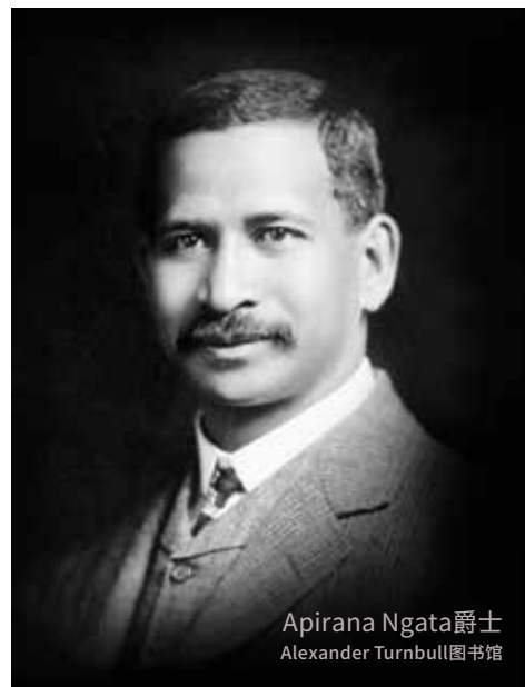
Apirana Ngata爵士

著名的毛利领袖Apirana Ngata爵士认识到毛利物质文化是保护部落知识和身份 (mātauranga-a-iwi) 的重要组成部分，特别是通过毛利会堂 (marae)，这里集合了部落历史、社会 and 身份认同。他的梦想是建立学习中心，为后代维护和保留传统做法。