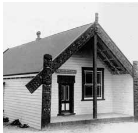
Te Ao Marama, Ohinemutu, Rotorua, circa 1930